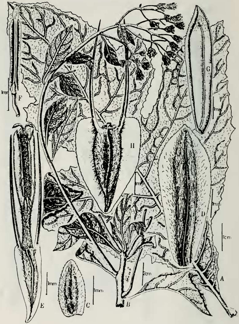
Fig. 2. Verbesina piurana Sagást. A. Hoja inferior, B. fragmento de la capitulescencia; C. filaria externa; D. filaria interna, E. flor, F. estambre, G. pálea del receptáculo, H. aquenio.